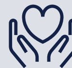
Subvenciones y donativos benéficos