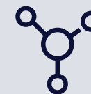
Búsquedas de información